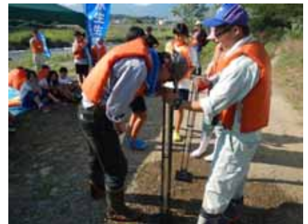
(千曲川依田川 合流点付近)