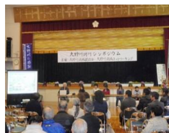
シンポジウムの開催