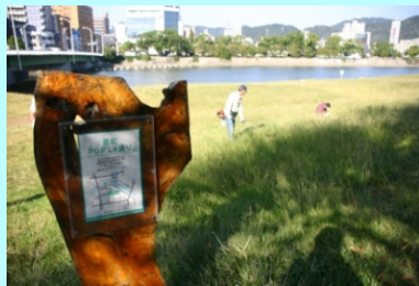
市民団体による看板設置事例（太田川）