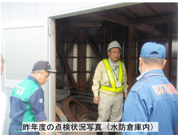
昨年度の点検状況写真（水防倉庫内）

日時 平成25年5月14日（火）13時30分から 集合場所 国道19号ラーメン大学下田店前ポケットパーキング