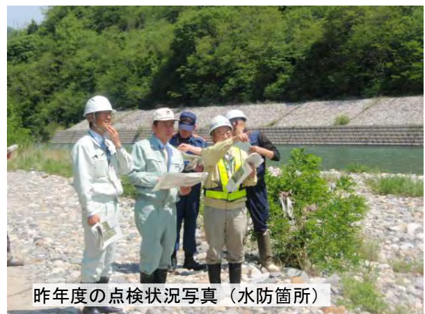
昨年度の点検状況写真（水防箇所）