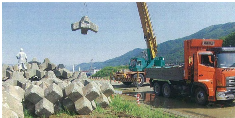
過去にあった運搬作業の様子