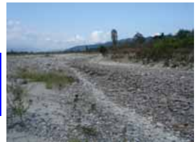
H21年9月26日発生瀬切れ 池田町林中付近

今回の追加放流により例年秋口に発生する高瀬川の瀬切れ に対する防止・軽減の効果が期待されます。