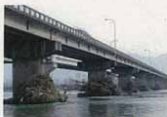
橋脚に堆積した流木