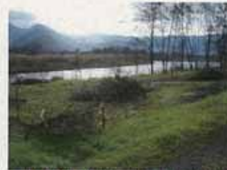
枝葉を残された区画の例