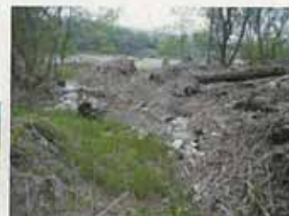
ゴミが引っかかる