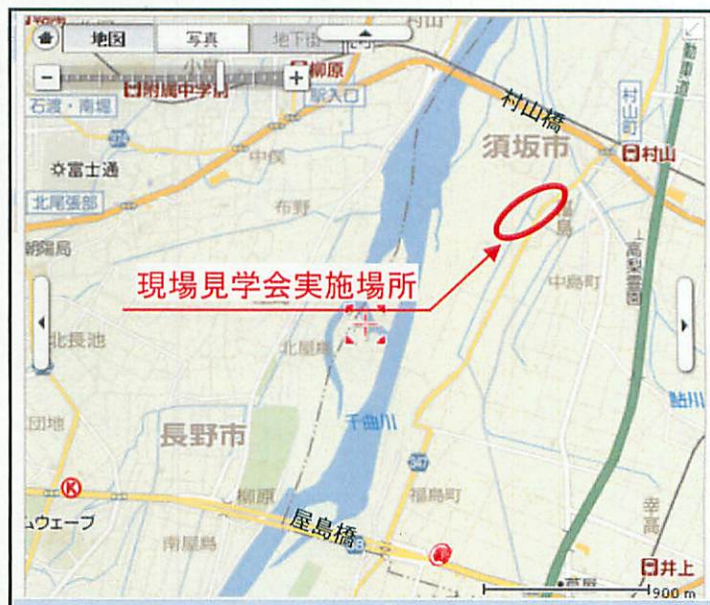
見学会実施場所位置図