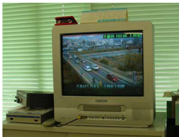
上田市役所に配信された河川映像 (写真は千曲川・上田橋)