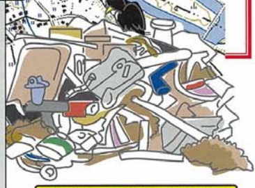
裏面は「更地地域配置図」