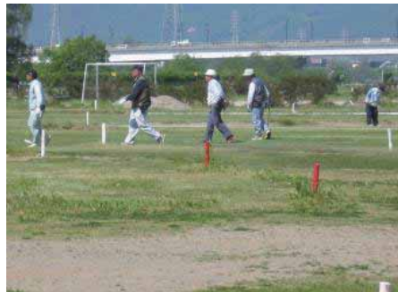
マレットゴルフ場の様子