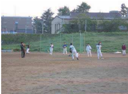
グラウンド（野球）の様子