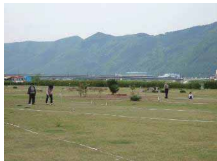
マレットゴルフ場の様子