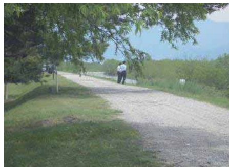
堤防道路 (休憩) の様子