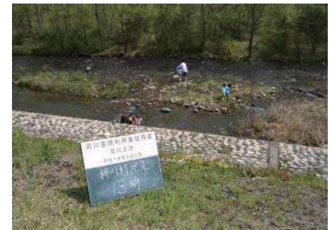
水面 (水遊び) の様子