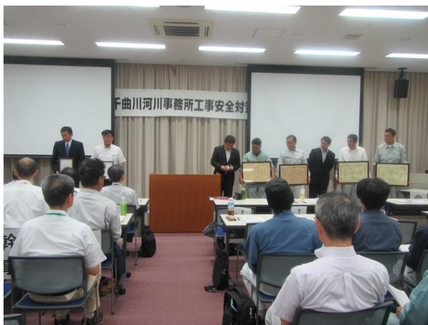
表彰・認定を受けられた皆様