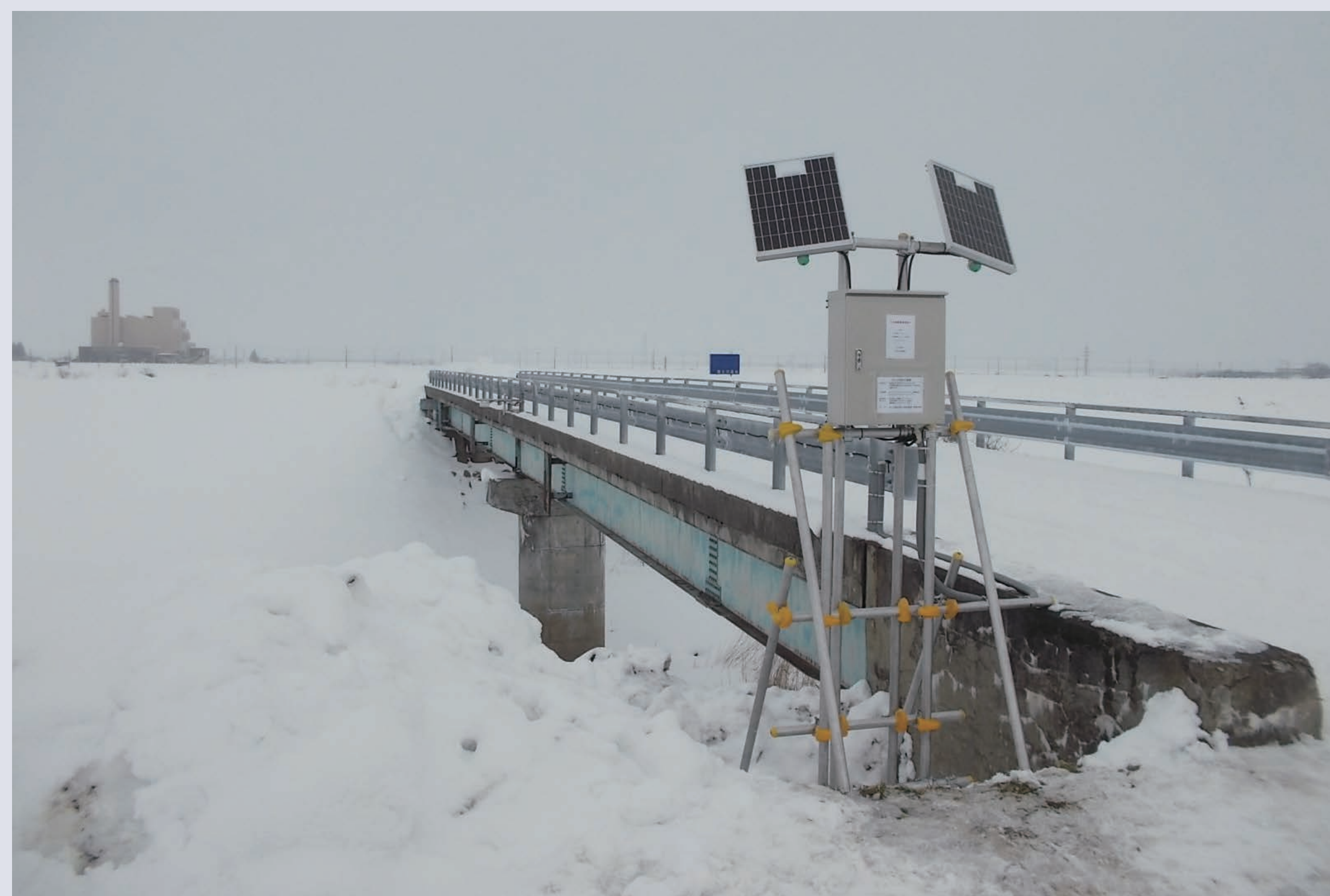
現場実証実験第二弾※寒冷地仕様(最上川水系)