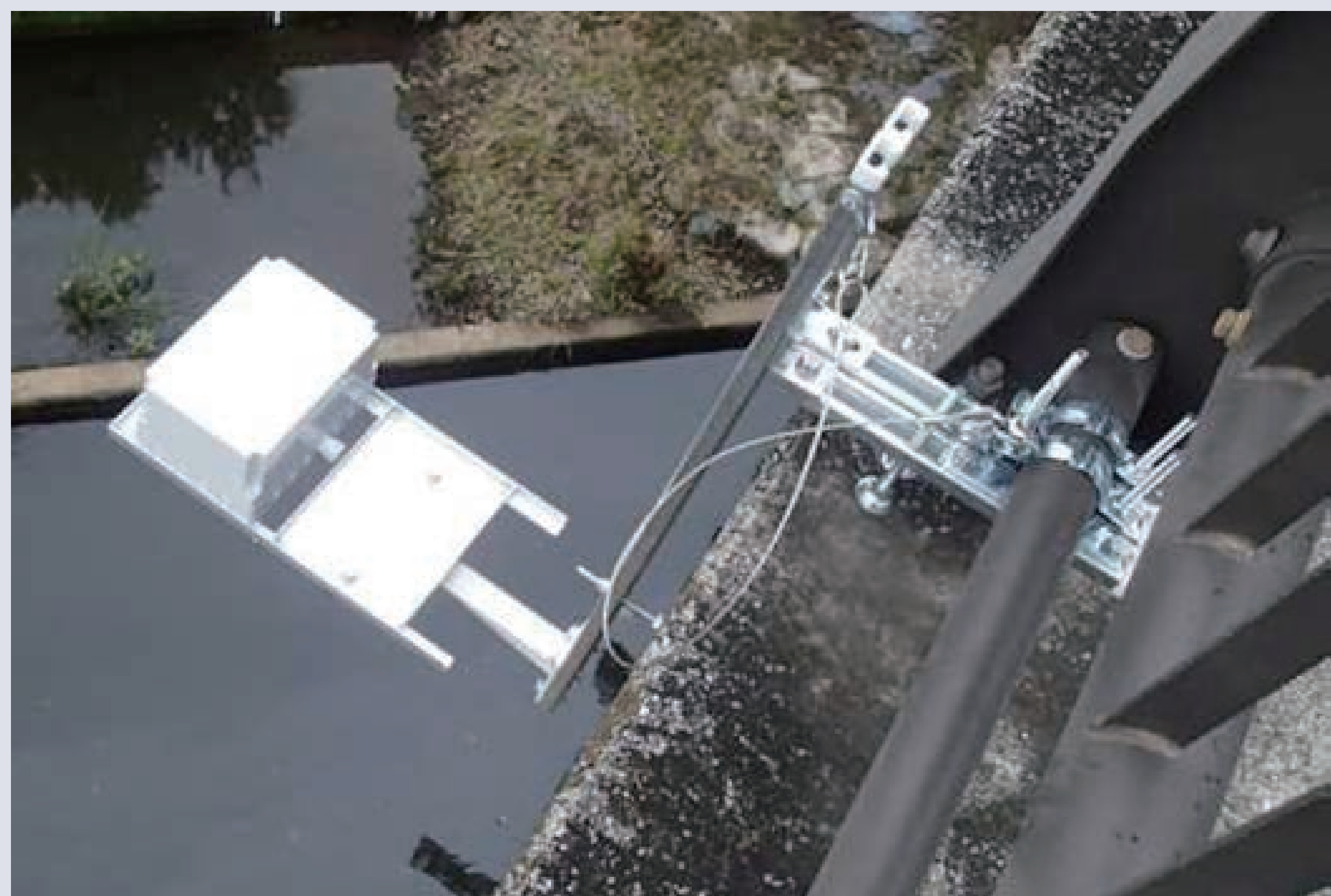
現場実証実験第一弾(鶴見川水系 鳥山川)