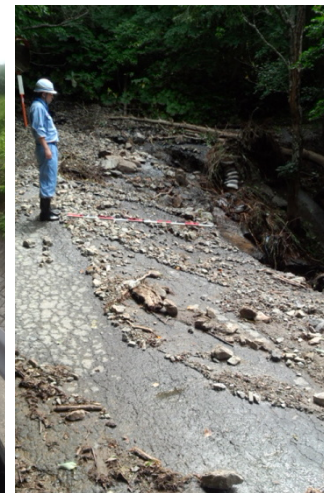
【本局道路部・羽越班、新国班、長国班、 本局用地部・湯沢砂防班、千曲川班】 安家地区の孤立集落へのアクセス道路の被災状況調査