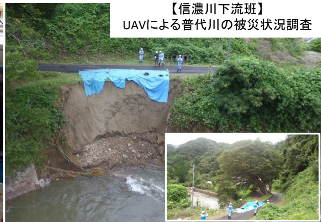
【信濃川下流班】 UAVによる普代川の被災状況調査