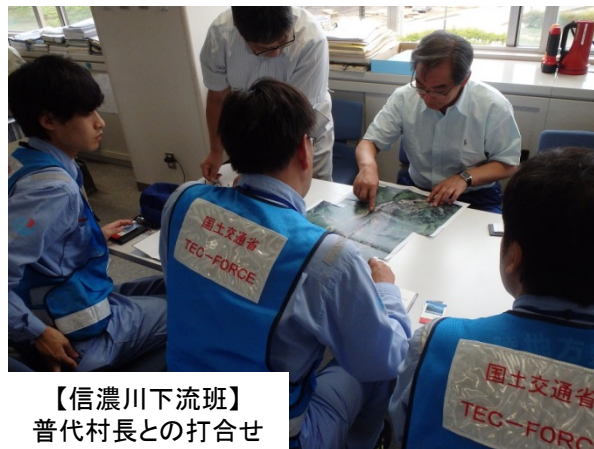
【信濃川下流班】 普代村長との打合せ