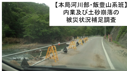
【本局河川部・飯豊山系班】 内業及び土砂崩落の 被災状況補足調査