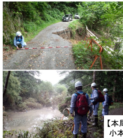
【本局用地部・湯沢砂防班】 小本川等の被災状況調査