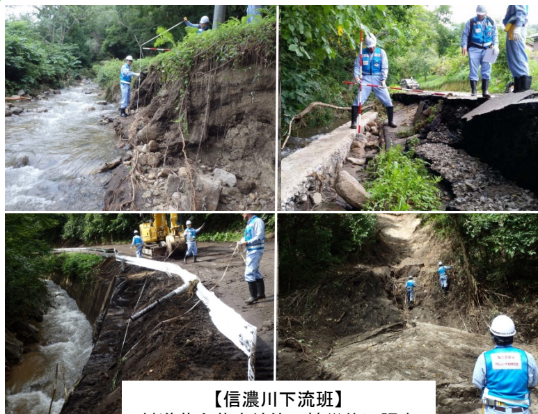
【信濃川下流班】 村道落合萩牛線等の被災状況調査