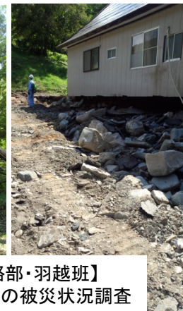
【本局道路部・羽越班】 林道大石沢線の被災状況調査