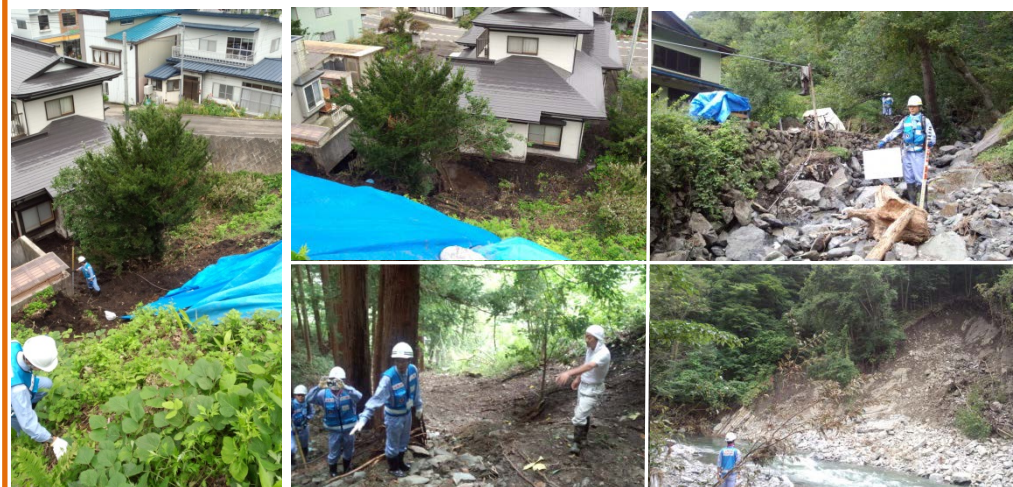
【本局河川部・飯豊山系班】 土砂崩落の被災状況調査