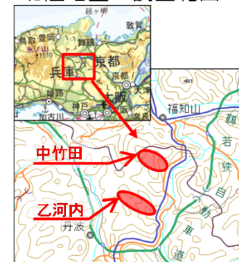
北陸地整の調査範囲