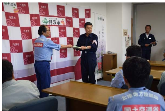
辻丹波市長からのお礼の挨拶