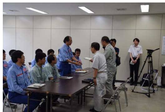
安川丹波土木事務所長への報告