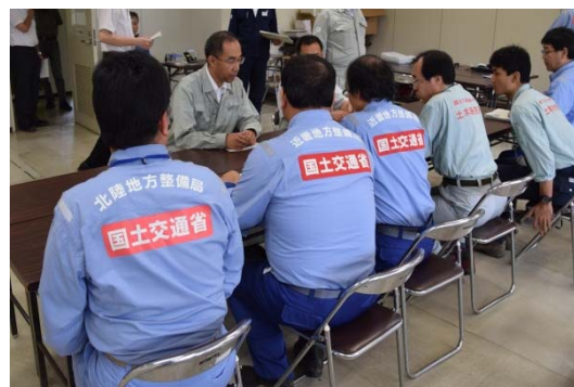
安川丹波土木事務所長への報告