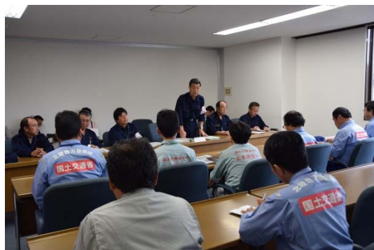
辻丹波市長からのお礼の挨拶