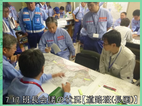
7.17 班長会議の状況【道路班(長国)】