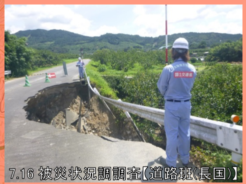
7.16 被災状況調査【道路班(長国)】