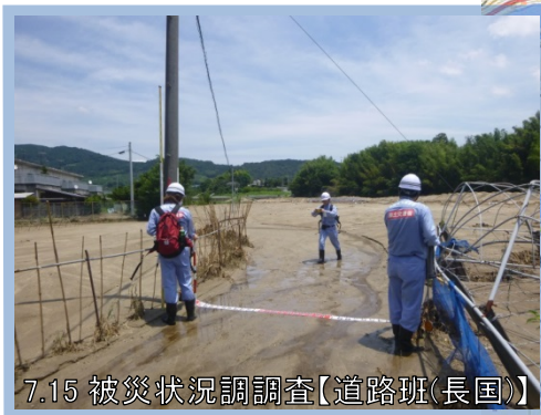
7.15 被災状況調査【道路班(長国)】