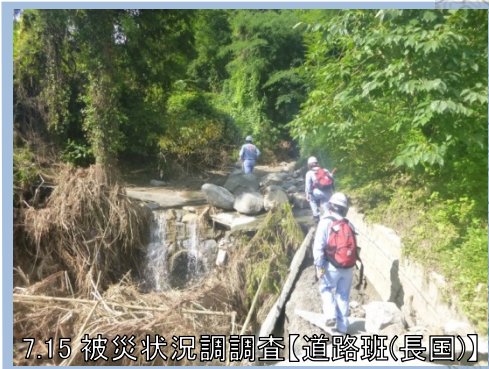
7.15 被災状況調査【道路班(長国)】