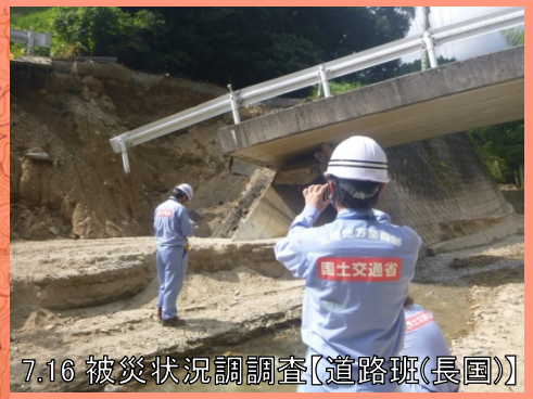
7.16 被災状況調査【道路班(長国)】