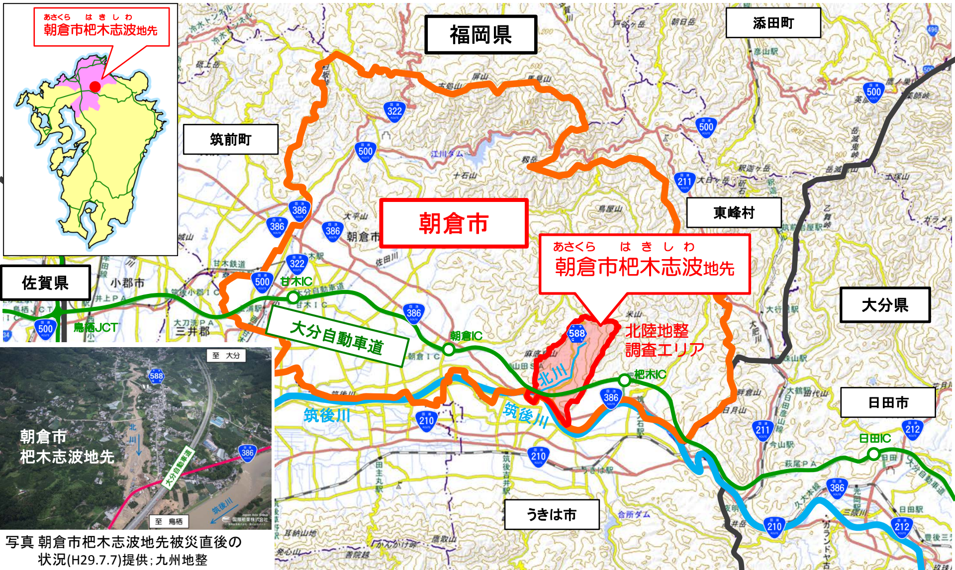
写真 朝倉市杷木志波地先被災直後の状況(H29.7.7)

■北陸地方整備局では、土砂災害や河川の氾濫などにより市道多数が被災している福岡県朝倉市杷木志波地先において、道路の被災状況調査を実施しています。【現地活動は1班(長岡国道)】