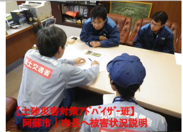
【土砂災害対策アドバイザー班】 阿蘇市 | 市長へ被害状況説明