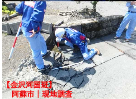
【金沢河国班】 阿蘇市 | 現地調査