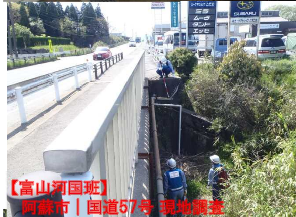
【富山河国班】 阿蘇市 | 国道57号 現地調査