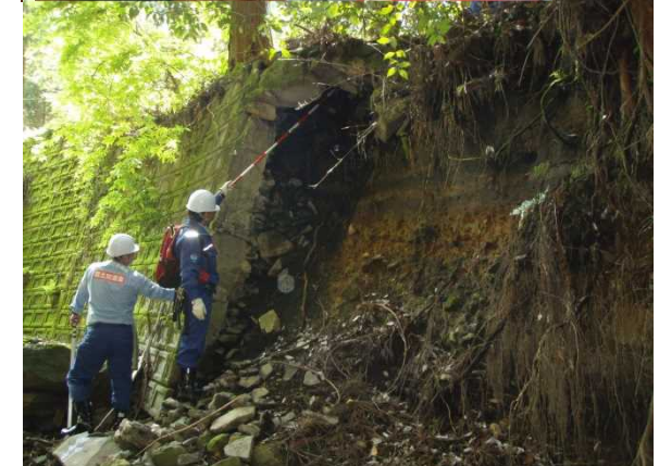
【本局班】 すだれ川等 | 現地調査