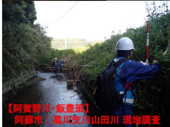
【阿賀野川・飯豊班】 阿蘇市 | 黒川支川山田川 現地調査