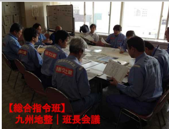
【総合指令班】 九州地整 | 班長会議