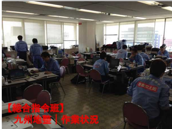
【総合指令班】 九州地整 | 作業状況