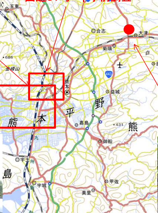
【羽越河国道班】 ・大津町 | 現地調査