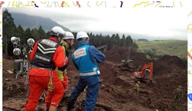
【土砂災害対策アドバイザー班】 ・南阿蘇村 | 現地調査