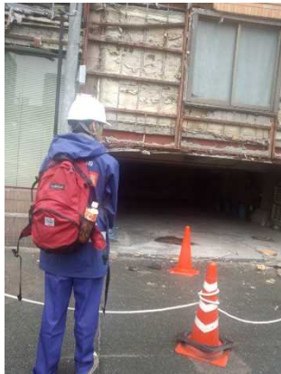
【被災状況調査班(営繕)】 ・熊本市中央区 | 現地調査