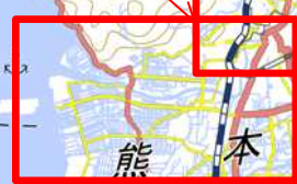
【砂防本部班 松本砂防班 神通川班】 ・熊本市西区 | 現地調査