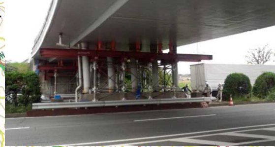
【新潟国道班】 ・国道57号 | 事前調査