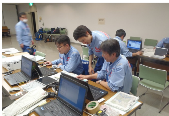
調査結果とりまとめ