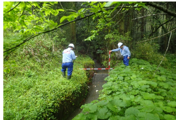
土石流溪流調査(旧豊野町内)