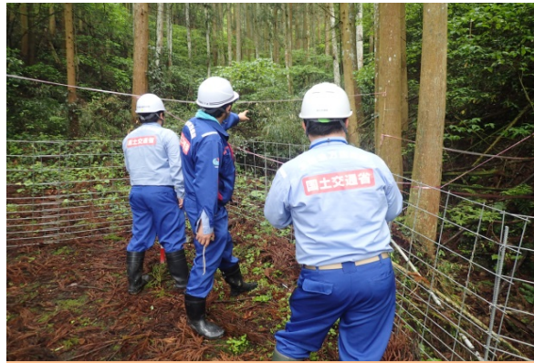
土石流溪流調査(宇城市内)