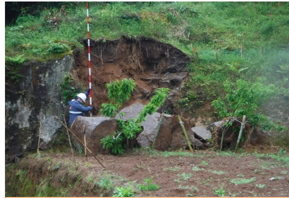
急傾斜地調査(宇城市内)