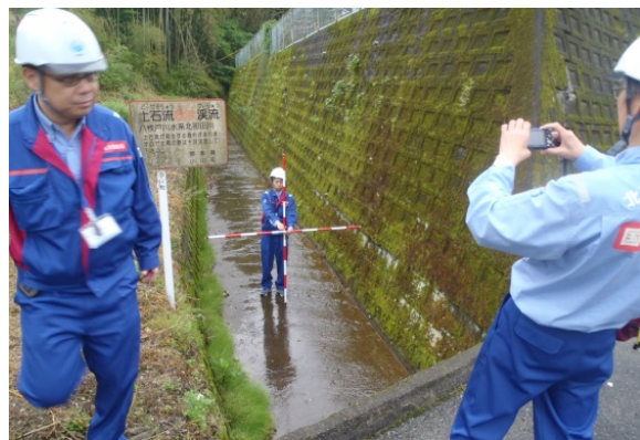
土石流溪流調査(宇城市内)