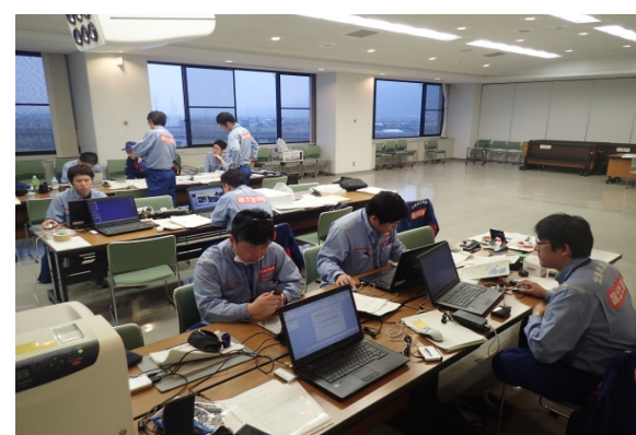
調査結果とりまとめ