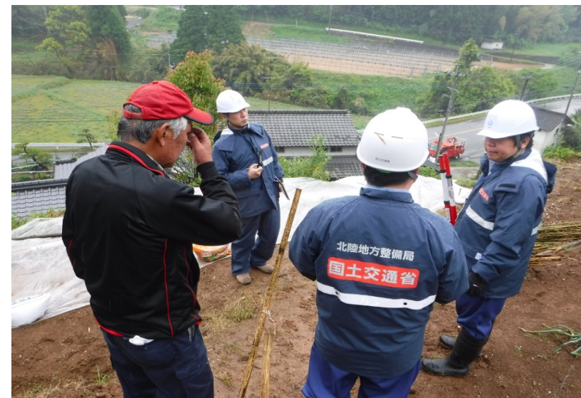
被害状況を住民より聞き取り