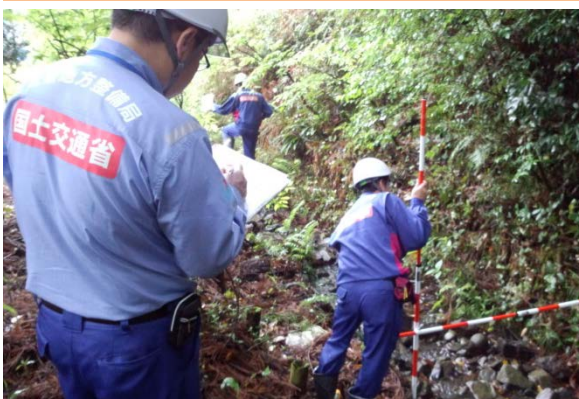
土石流溪流調査(旧豊野町内)