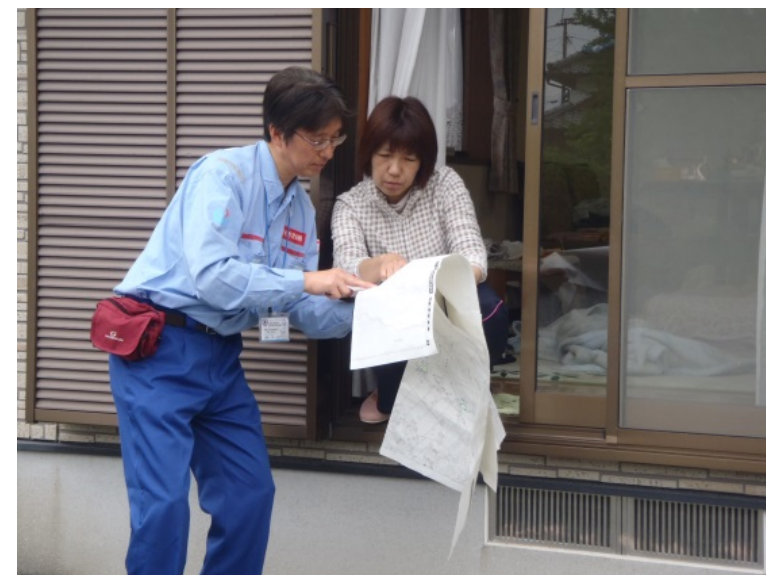
被害状況を住民より聞き取り