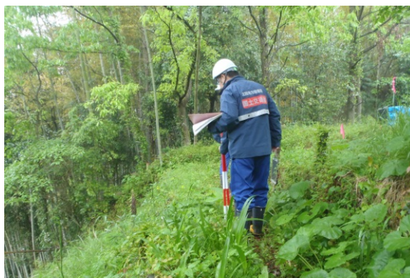
急傾斜地調査(宇城市内)