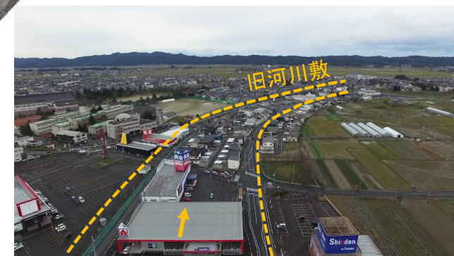
▲市街化が進んだ旧河川敷