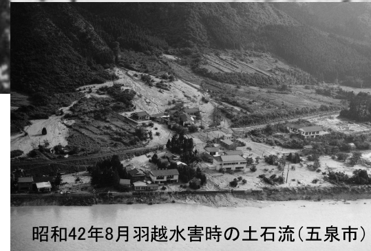
昭和42年8月羽越水害時の土石流(五泉市)