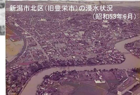
新潟市北区(旧豊栄市)の浸水状況 (昭和53年6月)