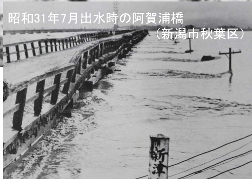
昭和31年7月出水時の阿賀浦橋 (新潟市秋葉区)