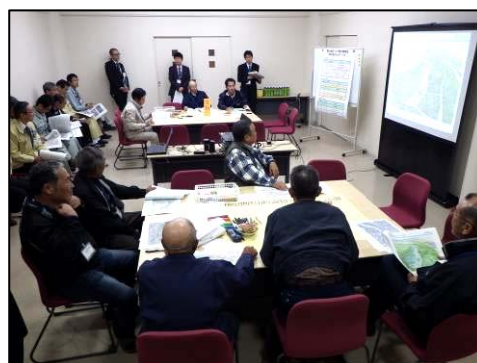
ワンド再生イメージへの意見交換