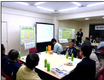
全体意見まとめ・発表

焼山地区ワンドの利活用のアイデアを踏まえて、実際の利活用にあたって課題となること、及びその解決に向けたアイデアについて、ご意見をいただきました。