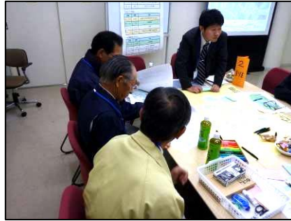
2班のグループ作業風景