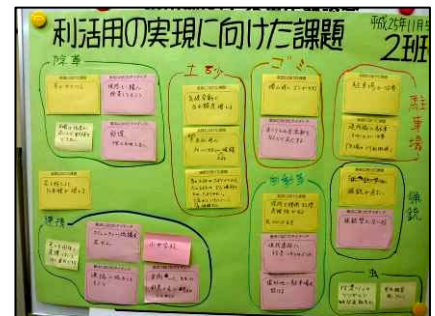
2班の意見をまとめたパネル