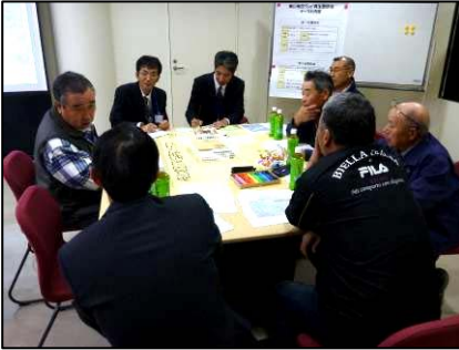
1班のグループ作業風景

地域の皆様に焼山地区のワンドに対する愛着を持っていただく最初のきっかけとなる記念イベントの実現に向けて、日常的な活用とイベント利活用についてアイデアを出していただきました。