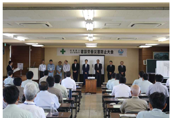
昨年度の建設労働災害防止大会