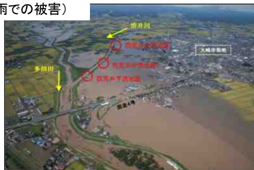
（宮城県 菅井川での決壊）