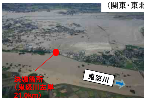
（茨城県 鬼怒川での決壊）