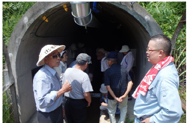
排水トンネルの視察