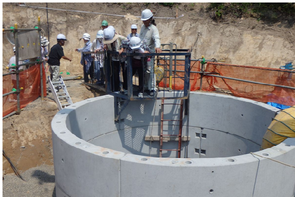
しゅうすいせい 集水井の視察