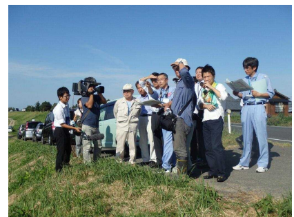
昨年の第4回自然再生検討会での現地視察の様子