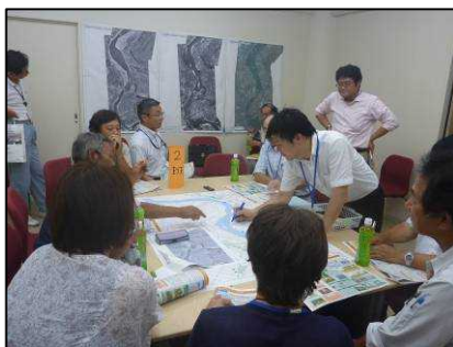
2班のグループ作業風景