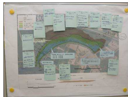
2班の意見をまとめた平面図