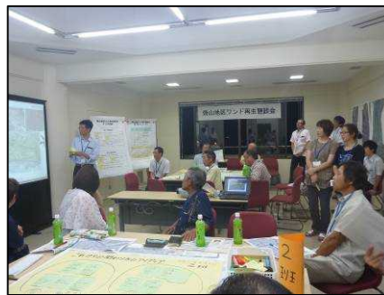
2班に分かれて作業