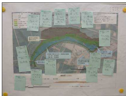
1班の意見をまとめた平面図