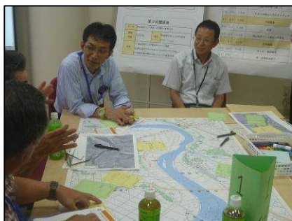
1班のグループ作業風景

昔の川と人の関わり方が今よりも密接だった頃の阿賀野川の思い出をふまえて、これからの阿賀野川と人の関わり方がこんな風になればいいな、というアイデアを出していただきました。