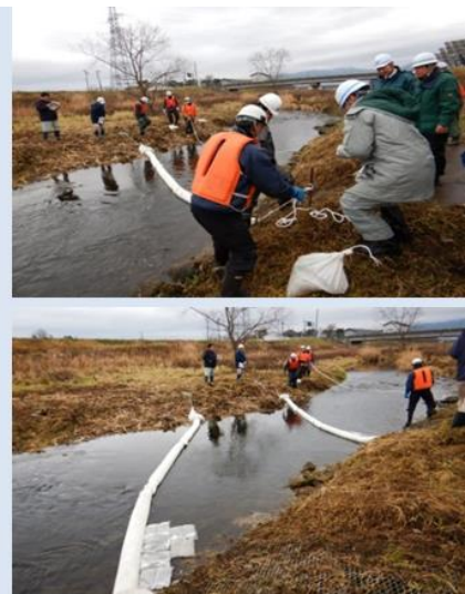
H30訓練実施時の様子