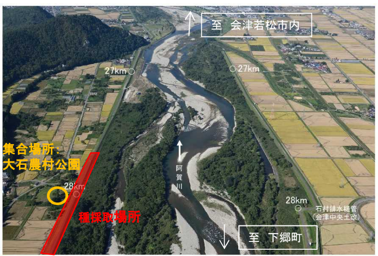
70 阿賀川 距離標 28km 下流向き 2016年10月7日撮影