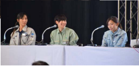
ステージイベント(けんせつこまちドキ!スペシャル)