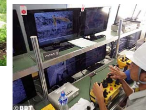
無人化施工工体験