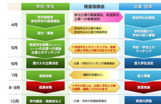
インターンシップの流れ